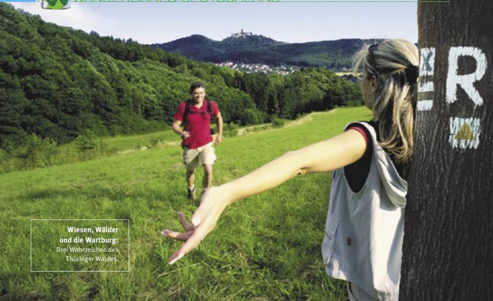
Wiesen, Wälder und die Wartburg: Drei Wahrzeichen des Thüringer Waldes.

L etzte Nebelschwaden ziehen am frühen Morgen noch durch dichte Wälder, klammern sich an knorrige Äste und verlieren doch den Kampf gegen die Sonne. Zeit zum tiefem Durchatmen, zum Stiefel schnüren und Loswandern. Mit jedem Schritt fällt ein Stück Last ab, der Alltagsstress kann nicht mehr mithalten, bleibt bald weit zurück und gibt schließlich auf. Ein würziger Duft aus Tannenharz und feuchtem Moos erfüllt die Luft. Über den Baumwipfeln ist der Ruf eines Bussards zu hören. Irgendwo raschelt es im Unterholz. Blumen malen bunte Tupfer in grüne Wiesen. Einsame Hochmoore und dichte Fichtenwälder liegen am Weg, sie scheinen etliche Geheimnisse zu hüten.