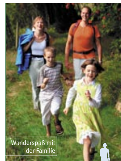
Wanderspaß mit der Familie